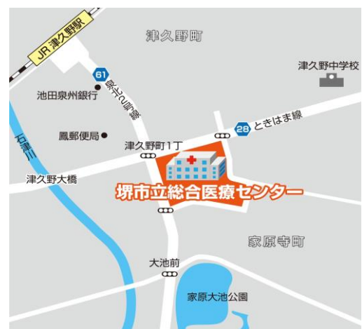
JR 阪和線津久野駅から徒歩5分